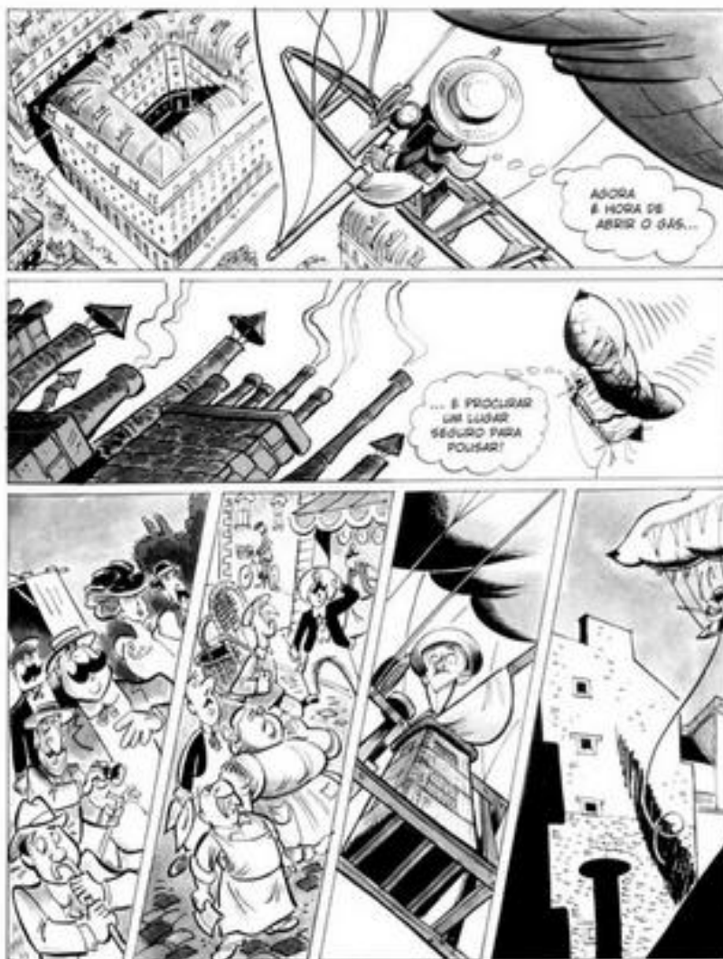
Santô – Quadrinhos na Educação, p.53