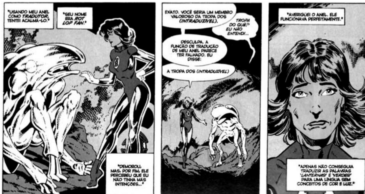
Lanterna Verde Katma Tui - Quadrinhos na Educação, p.85